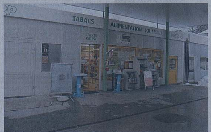
Les malfrats ont pénétré dans le magasin en fracturant une vitrine.